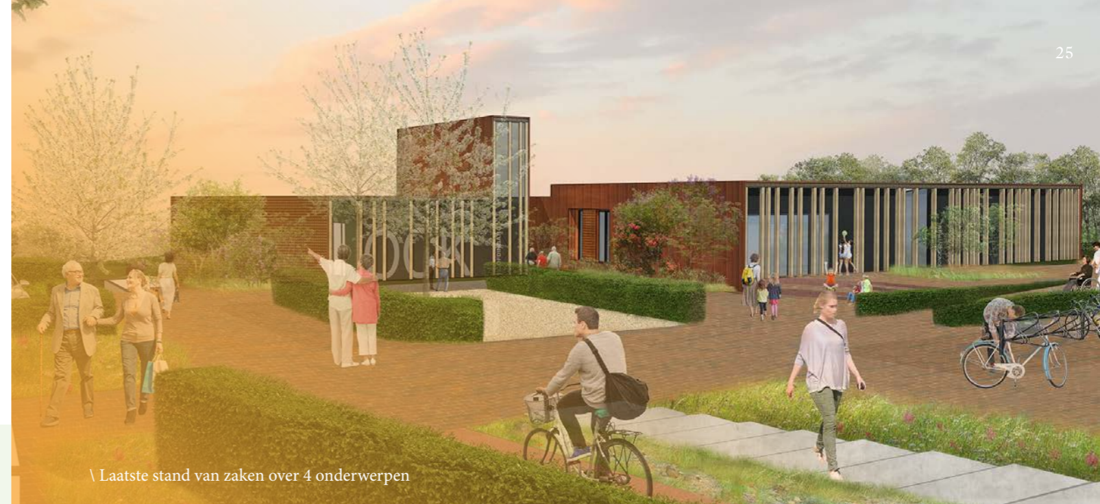
\ Laatste stand van zaken over 4 onderwerpen