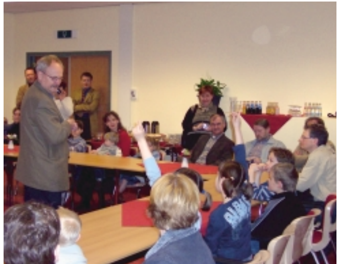
Genoeg kinderen weten het antwoord op de vraag "wat is een brede school?"

Op 7 april jl. hebben kinderen van de basisscholen Dammerich en Kunrade, de peuterspeelzaal de eerste stap, het kinderdagverblijf Catootje, de buitenschoolse opvang de Foekepot en wethouder Bressers de website www.bredeschoolvoerendaal.nl op ludieke wijze in gebruik genomen in het cultureel centrum de Borenburg.