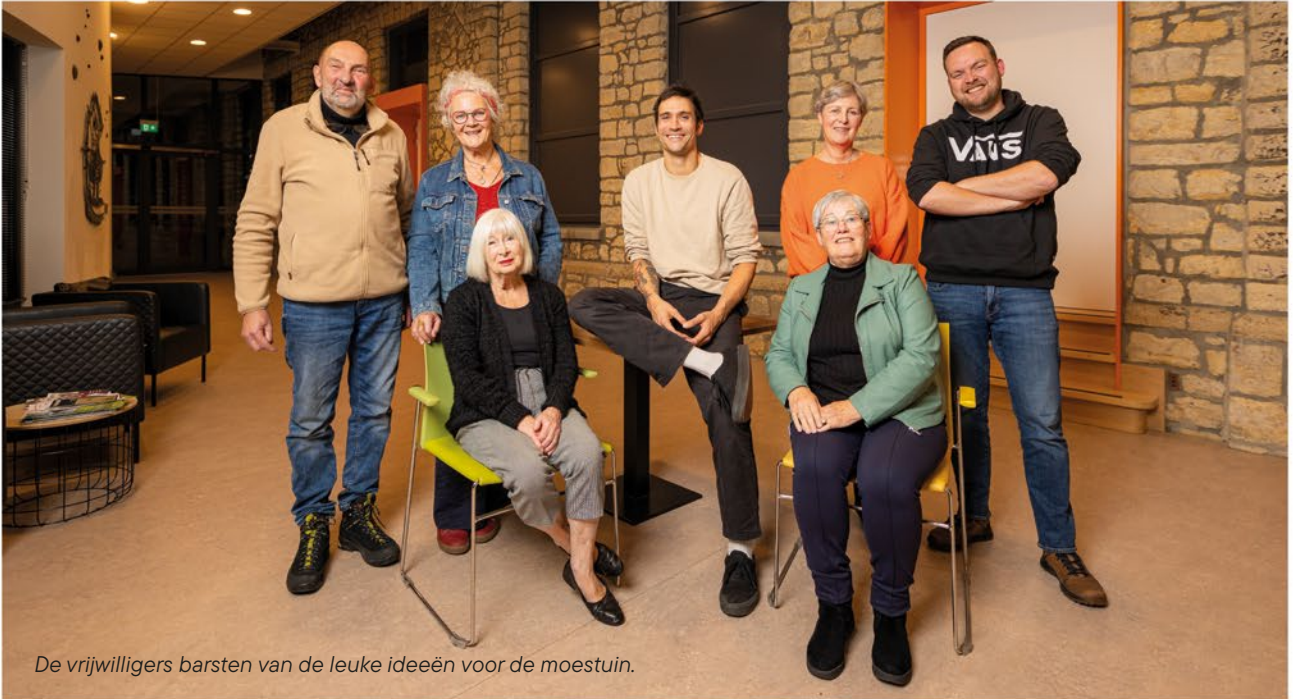
De vrijwilligers barsten van de leuke ideeën voor de moestuin.